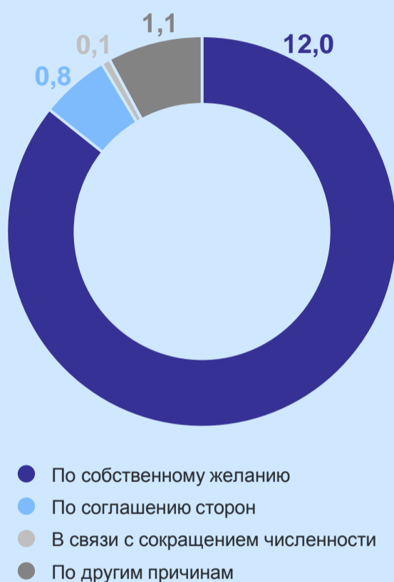
Распределение численности выбывших работников организаций по причинам выбытия, тыс. человек