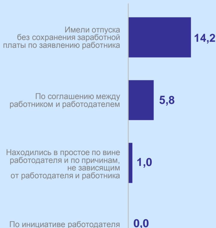
Численность работников, работавших неполное рабочее время, тыс. человек