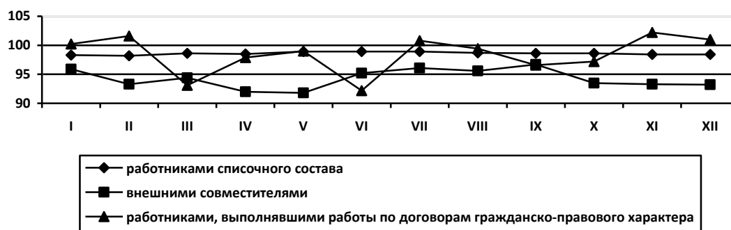
Динамика числа замещенных рабочих мест в организациях (без субъектов малого предпринимательства) по месяцам 2018 года (в % к соответствующему месяцу предыдущего года)

Безработица. В среднем за 3 месяца (октябрь-декабрь) 2018 г., по итогам выборочно-го обследования рабочей силы, 20 тыс. человек, или 3,9% рабочей силы классифицировались как безработные (в соответствии с методологией Международной Организации Труда).