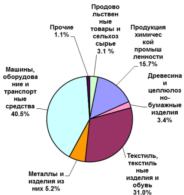
Страны дальнего зарубежья