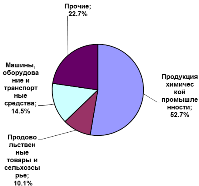
Страны дальнего зарубежья