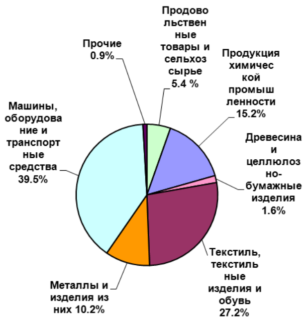
Страны дальнего зарубежья