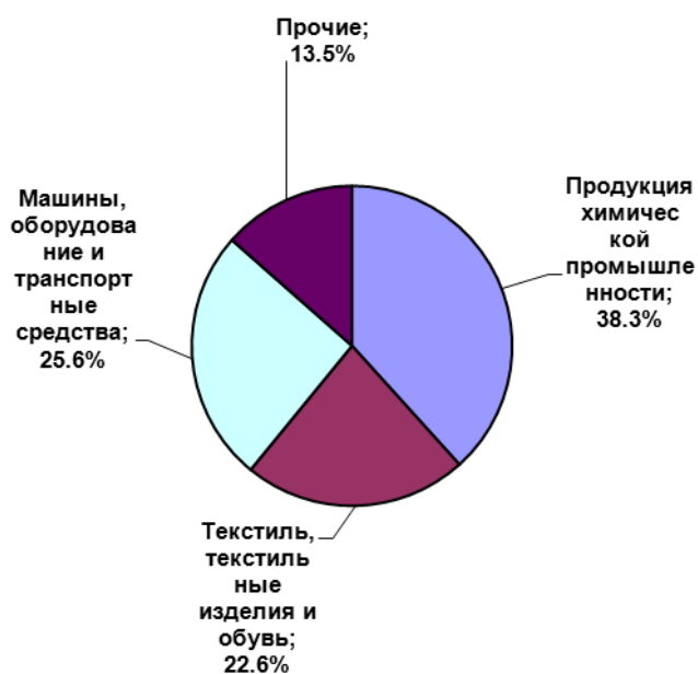
Страны дальнего зарубежья